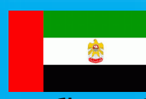
Об'єднані Арабські Емірати

Послугами колективних засобів розміщування скористались 289,9 тис. гостей області, з них 16,5% – іноземні громадяни